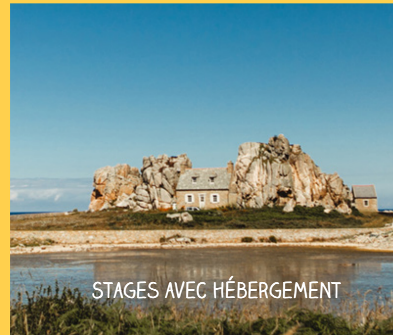
STAGES AVEC HÉBERGEMENT